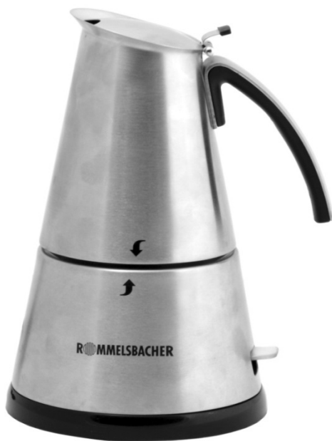
EKO 364/E EKO 366/E