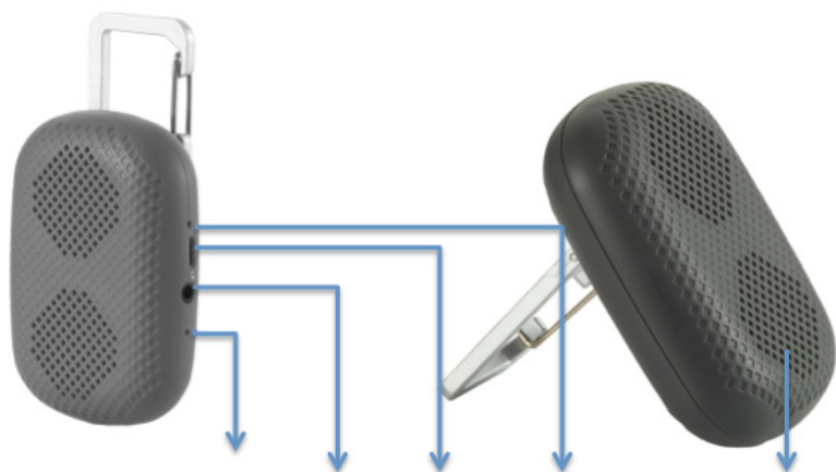
Микрофон, AUX-порт, USB зарядка, LED индикатор Динамик