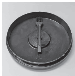
Щетка для чистки