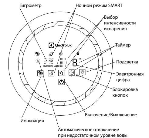
Рис. 3. Дисплей и панель управления