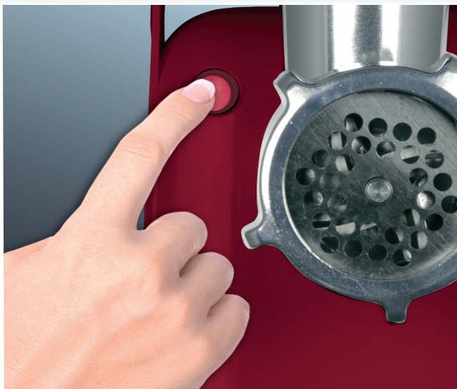
Кнопка фиксации рабочего блока