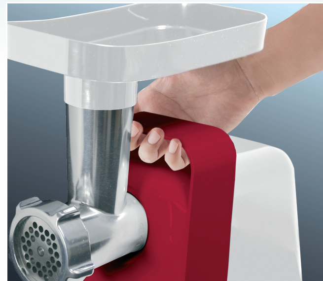
Удобная ручка для переноски