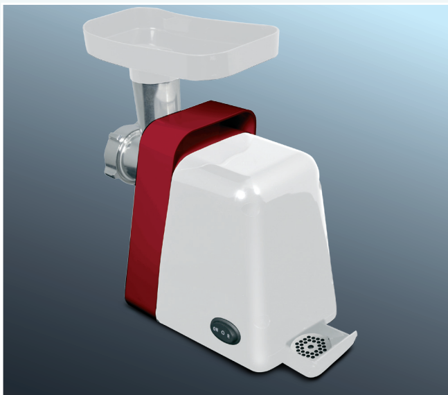
Отсек для хранения аксессуаров